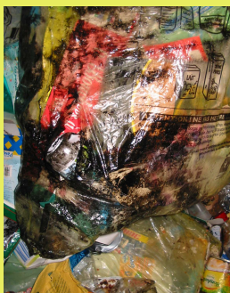
Huile de vidange dans les bacs jaunes ?