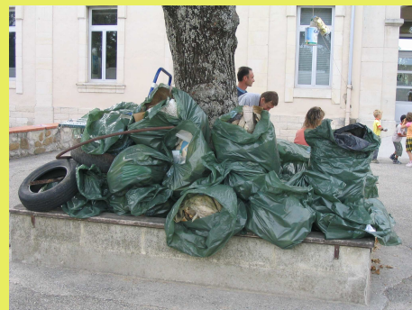
Les déchets trouvés dans la nature par les enfants de l'école primaire de Grillon