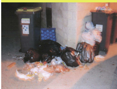
Un peu de civisme et de respect pour votre entourage !!!